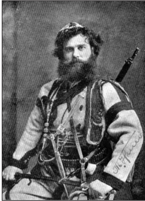
Тане Николов 1873 – 1947

През тази година се навършват 70 години от кончината на един от най-отдадените радетели на Националния идеал за единението на българския народ в една държава - Войводата Тане Николов.